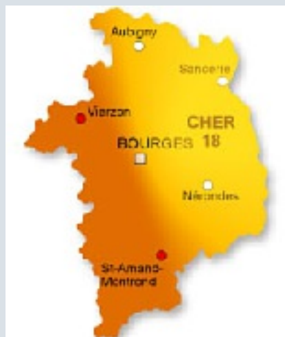
Carte du Départment du Cher