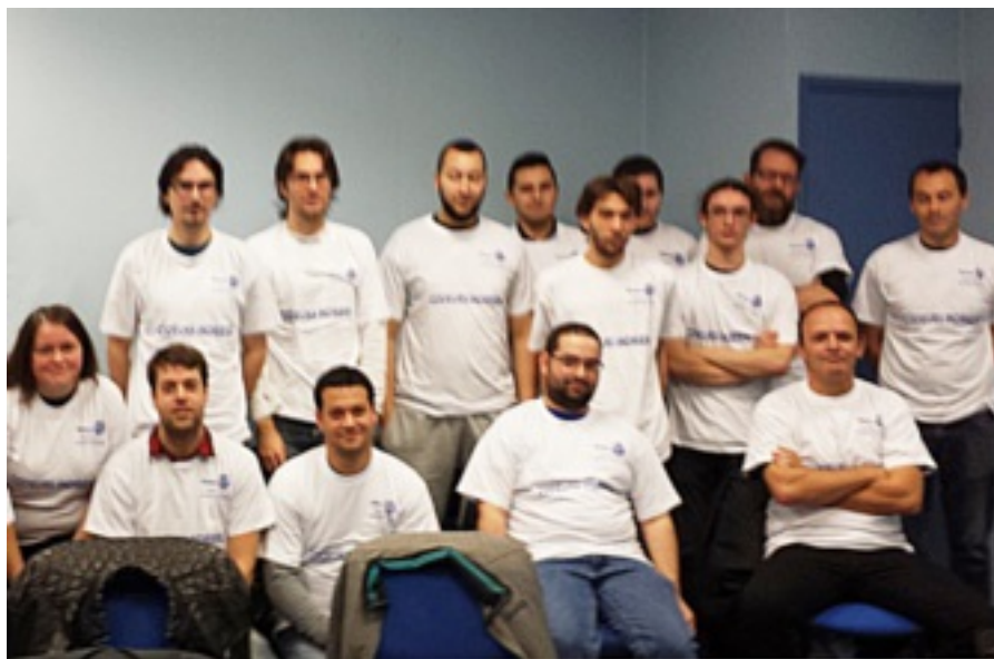
Ci-dessus : une partie du premier groupe de personnes formées

Simplon bénéficie du soutien du Gouvernement dans le cadre des labellisations « French Tech », « La France S'Engage » et « Grande Ecole du numérique ».