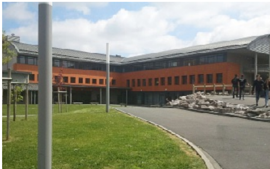
Le lycée Saint-Joseph à Saint-Martin Boulogne, un partenariat de plus de 10 ans, avec conférences "recherche d'emploi", simulation d'entretiens d'embauche en anglais et autres interventions personnalisées.

D'un territoire à l'autre, les mêmes problématiques