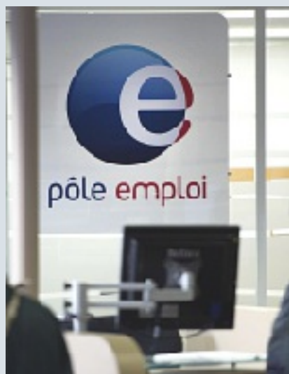
L'Agence Pôle Emploi de Saint-Amand-Montrond a joué un rôle moteur

Les personnes concernées étaient sans emploi depuis en moyenne 24 mois. Un constat : celles qui le sont depuis 3, 4, voire 5 ans deviennent difficilement "réemployables" et cumulent les problèmes de famille, de santé et autres.